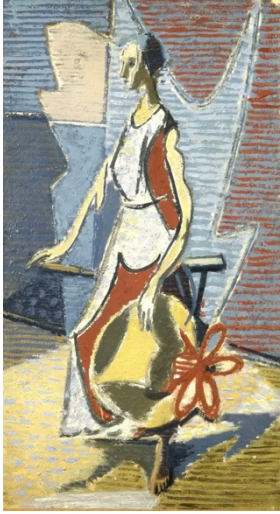
Modèle au tablier, 1934, 65 x 36cm