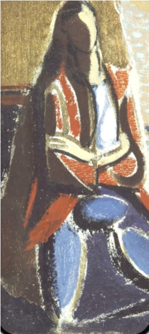
Modèle cubiste, 1933 27 x 19 cm

The gallery is pleased to present an exhibition dedicated to the career of artist and art theorist Nicolas Wacker (1897–1987) , highlighting his approach to painting, rooted in material experimentation and the transmission of knowledge.