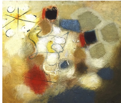
Noir-Blanc, 1974- Caparol et cire sur panneau, 31 x 35 cm

Cette période coïncide avec un débat en 1981, entre Claude Lévi-Strauss et Pierre Soulages autour de l'idée d'un « métier perdu ». Lévi-Strauss regrette la disparition des savoir-faire académiques traditionnels, tandis que Soulages répond dans un article intitulé « Le prétendu métier perdu ». Le métier n'a pas disparu : il se transforme sans cesse, en dialogue avec la matière et l'expérience artistique. Ce sont « mille métiers », chaque époque inventant ses propres pratiques*.