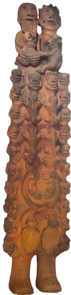
Couple aux 24 enfants, avec oiseaux, serpents etcaméléons 2023 195x 45 x 25 cm

Expositions collectives : Ex Africa , musée du Quai Branly-Jacques Chirac, Paris ; Fondation Louis Vuitton, Paris ; Pinacothèque Giovanni et Marella Agnelli, Turin ; Guggenheim, Bilbao. Film, Fatou Kande Senghor, 2015, présenté à Biennale de Venise.