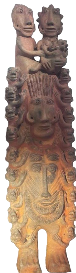
Famille, 2019, 150x45x35cm